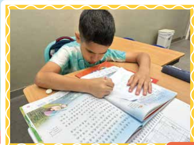
EM Tuition Class