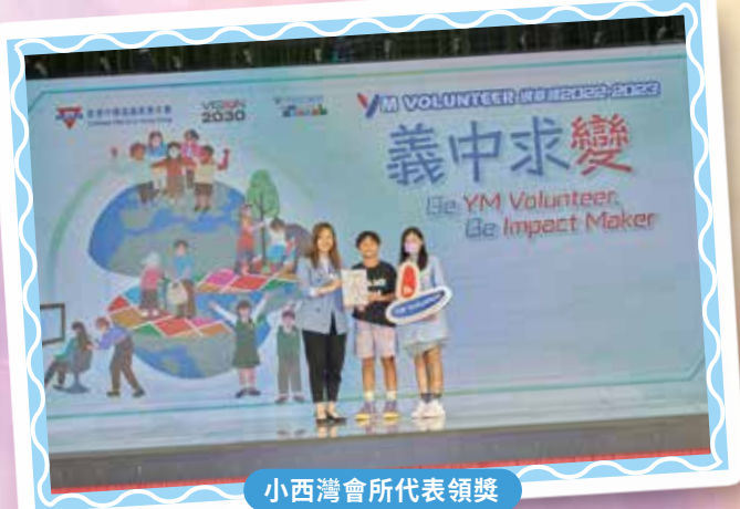
小西灣會所代表領獎