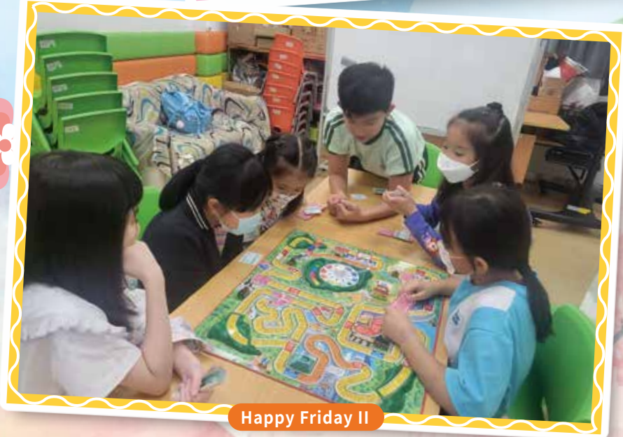
Happy Friday II