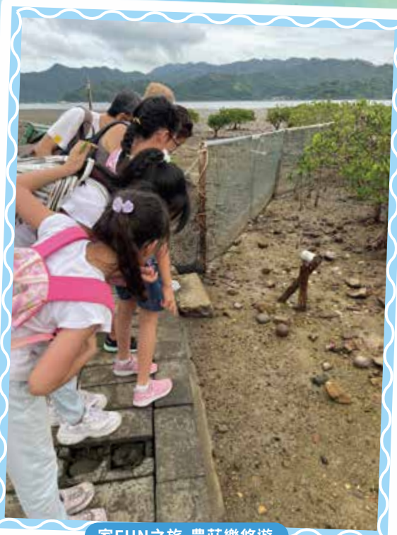
家FUN之旅-農莊樂悠遊