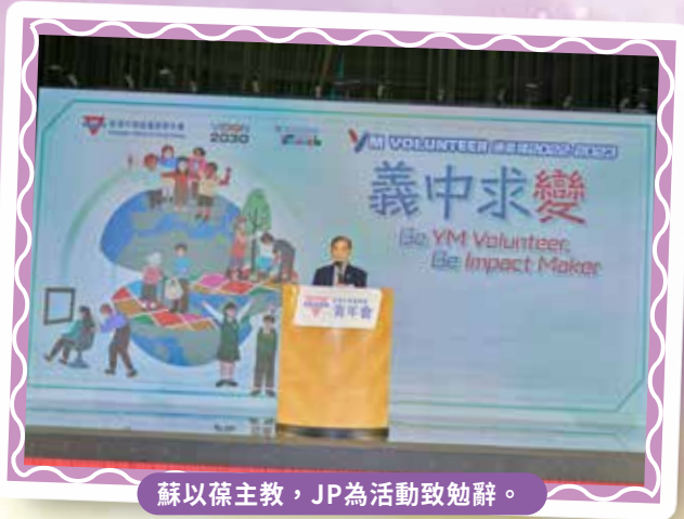
蘇以葆主教，JP為活動致勉辭。